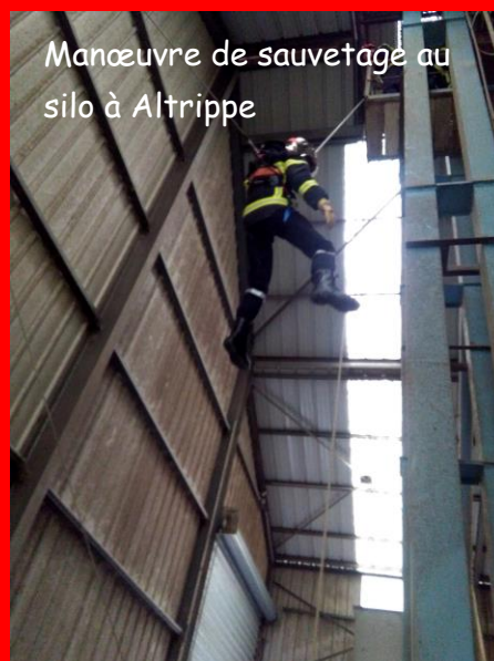
Manœuvre de sauvetage au silo à Altrippe