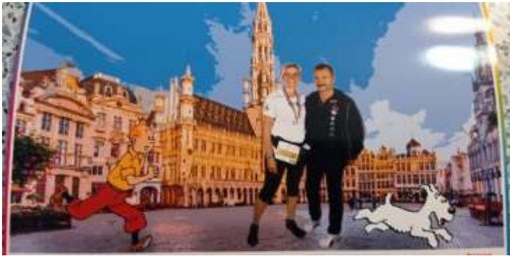
Semi marathon de Bruxelles