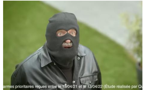
Armes prioritaires reçues entre le 13/04/21 et le 13/04/22 (Étude réalisée par Q...

Surtout n'hésitez pas, ayez le réflexe composez le « 17 » (gendarmerie).